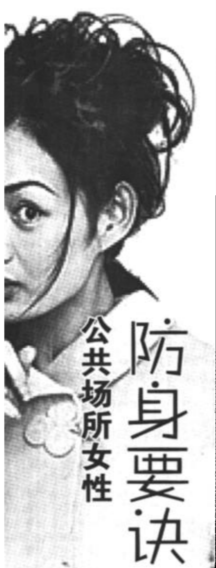
公共场合女性 防身要诀

女性晚上出门时最好拿件外套，将皮包裹住，避免被抢劫。应走灯光明亮的街道，一旦发现被跟踪，可以用脚或皮包拍打路边停着的车，敲响报警器发出响声，引起别人注意。