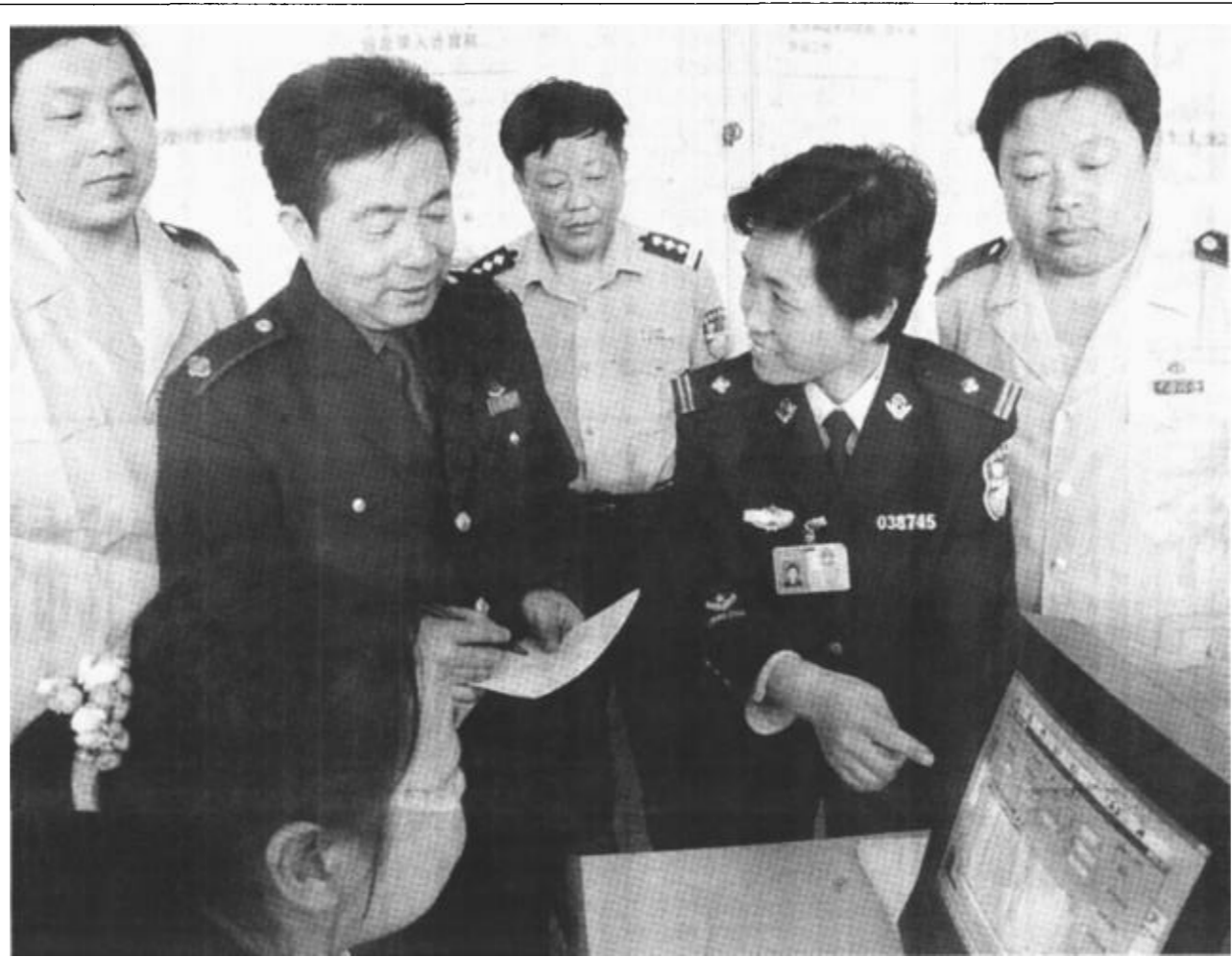
垦利县地税局针对社会零散税源不易控管这一现状，建立了县、乡、村三级控税系统，每个单位、村居配备了税收控管员，并建起了750个综合治税控管档案...