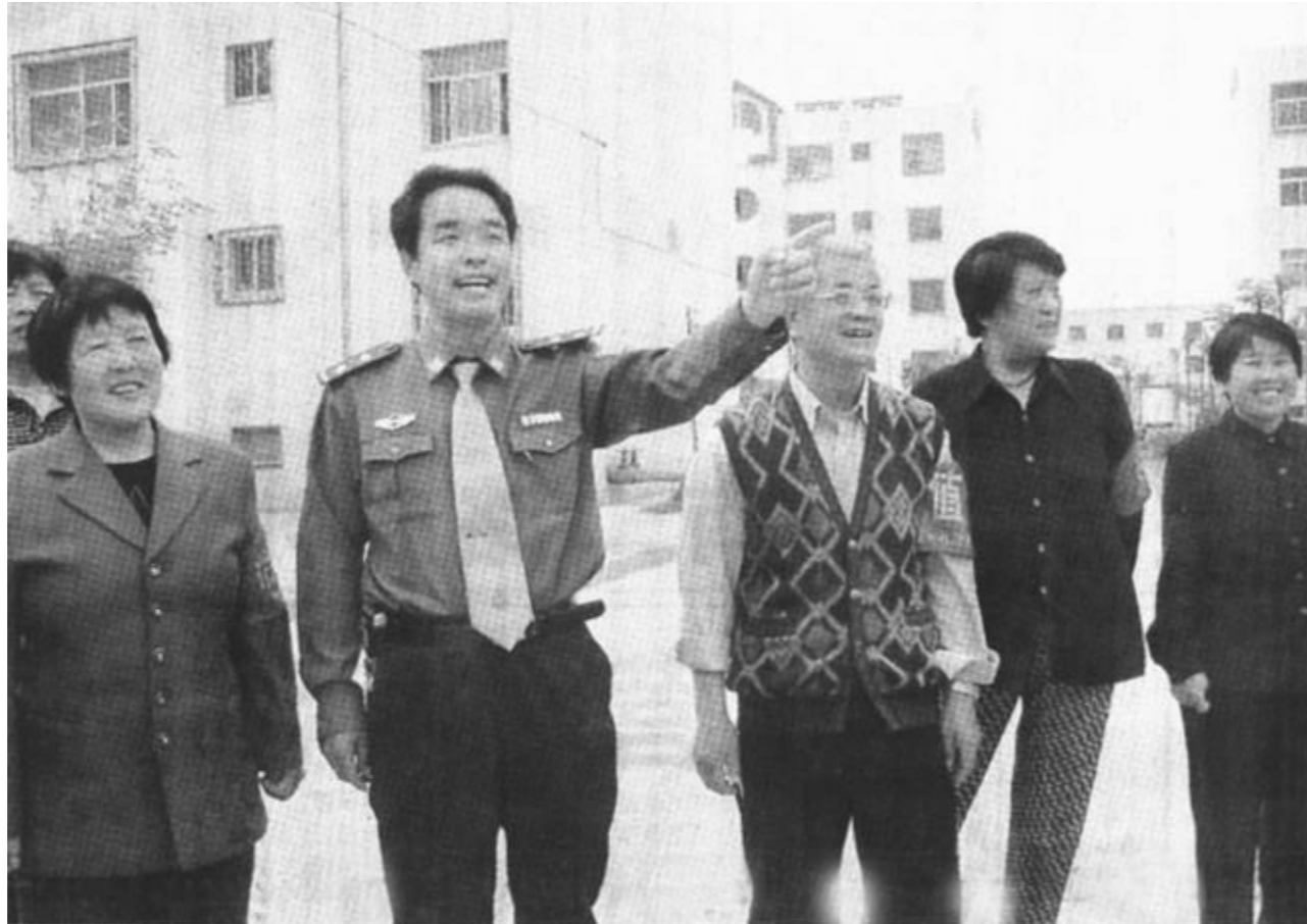
东营区东城街道组织社区警务人员与楼长联合在社区内巡逻,维护了治安,使社区居民生活安心。图为巡逻人员在社区内了解治安情况。

广饶县审计局开展了创建“五个好”文明执法群众满意活动。一是建立一个好的团结务实、廉洁勤政的坚强领导班子,二是建设一支好的扎实的党员干部和审计队伍,三是培养一种作风硬,工作扎实的作风,四是建立健全一套科学的、好的管理制度,五是齐心协力做出一番好的工作成绩。(本报通讯员)