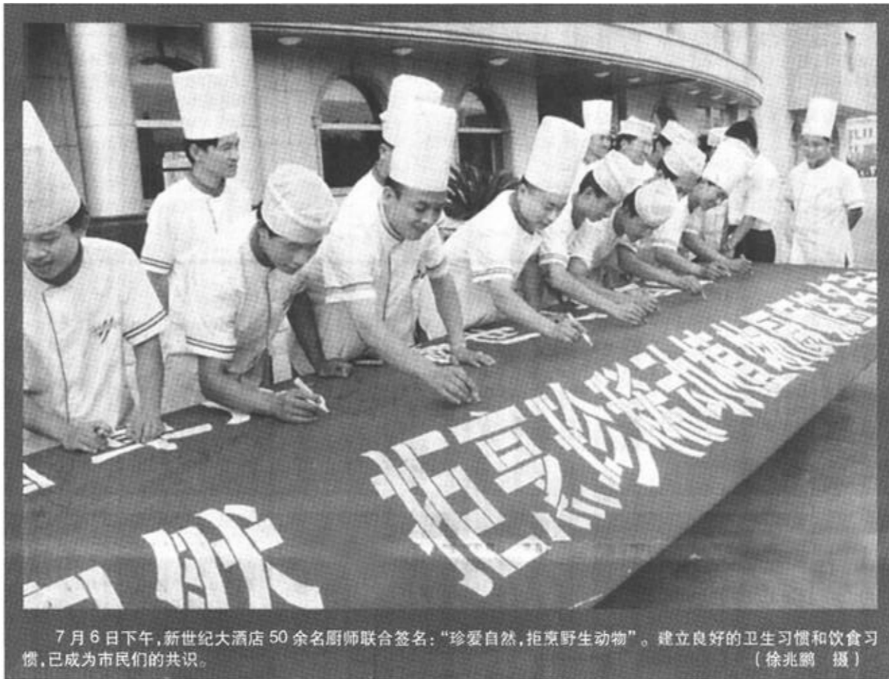
7月6日下午，新世纪大酒店50余名厨师联合签名：“珍爱自然，拒食野生动物”。建立良好的卫生习惯和饮食习惯，已成为市民们的共识。